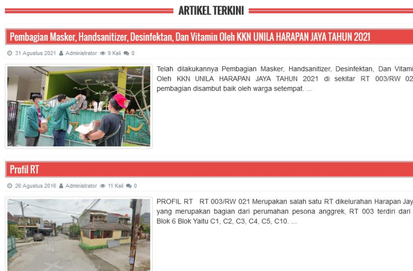
Gambar 3. Fitur artikel terkini profil RT.

Fitur ini berisikan informasi mengenai identitas RT 003, Kelurahan Harapan Jaya, Kecamatan Bekasi Utara, Kota Bekasi. Melalui fitur ini, diharapkan masyarakat di wilayah RT 003/RW 021 dapat dengan mudah mengakses informasi mengenai kegiatan yang sudah atau sedang berjalan di lingkungan RT 003.