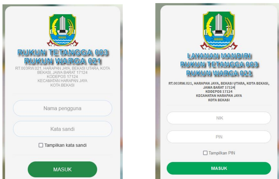
Gambar 6. Fitur login administrator dan login layanan mandiri

Sedangkan fitur login layanan masyarakat dilakukan oleh Masyarakat RT 003/RW 021, Kelurahan Harapan Jaya yang digunakan sebagai pelayanan secara mandiri oleh masyarakat untuk pembuatan atau permohonan surat yang dapat diakses secara online tanpa harus datang ke kantor RT.