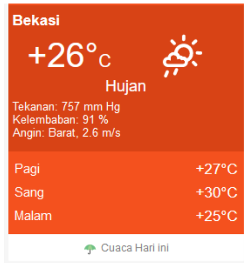
Gambar 4. Fitur data cuaca di Bekasi.

pembuatan Website Untuk Masyarakat Di Wilayah Rt 003/Rw 021, Kelurahan Harapan Jaya, Bekasi Utara mengetahui prakiraan cuaca yang ada di wilayah Bekasi dan dengan adanya fitur ini diharapkan masyarakat akan memperoleh kemudahan saat ingin beraktifitas di luar ruangan.